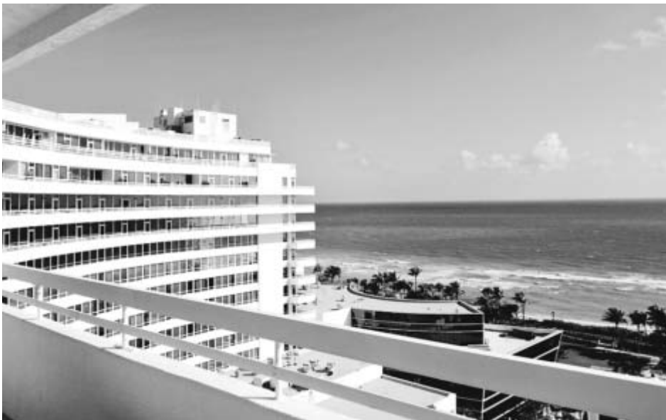
Investir dans l'immobilier en Floride séduit de plus en plus de Québécois. Sur notre photo, le Fontainebleau, à Miami Beach.

La crise actuelle a toutefois ralenti les activités de l'entreprise, qui a réduit son effectif à 15 personnes. Mais « on voit la reprise, particulièrement dans les projets de rénovation », note M. Proulx, qui a